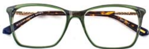
Mooie combinatie van groen en een schildpadmotief GANT (30470873, € 169)

GANT! Het Amerikaans lifestyle merk dat bekend staat om de veelzijdige sportieve en casual maar toch geklede looks voor elke gelegenheid. Specsavers introduceert 22 verschillende GANT monturen en 4 zonnebrillen vanaf € 169.