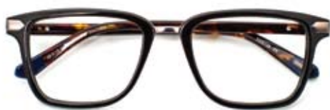
Strak design met een chique metalen neusbrug GANT (30470804, € 199)