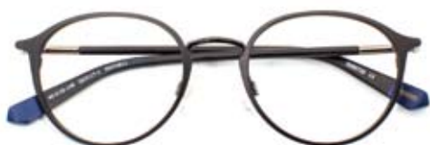
Creëer de ultieme vintage look met dit ronde montuur GANT (30470811, € 199)