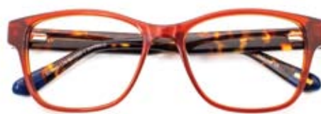
Orange is the new... GANT (30470810, € 199)