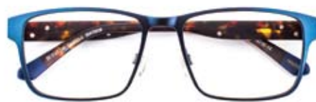
Metal blue, ideaal bij een mooie jeans GANT (30470828, € 199)