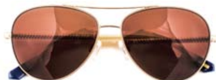
Good old aviator! GANT (30470965, € 199)